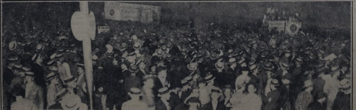
UN ASPECTO DE LA GRANDIOSA REUNION SOCIALISTA DE ANOCHE, EN CORRIENTES Y CARLOS PELLEGRINI

Es que, en verdad, instituciones de esta naturaleza son un peligro para las empresas. Su ejemplo puede cundir y el gran negocio desaparecer. Según la memoria y balance del segundo ejercicio al 31 de diciembre de 1928 — los últimos aparecidos — la Cooperativa de Luz y Fuerza sobre una venta de energía de 66.462 pesos